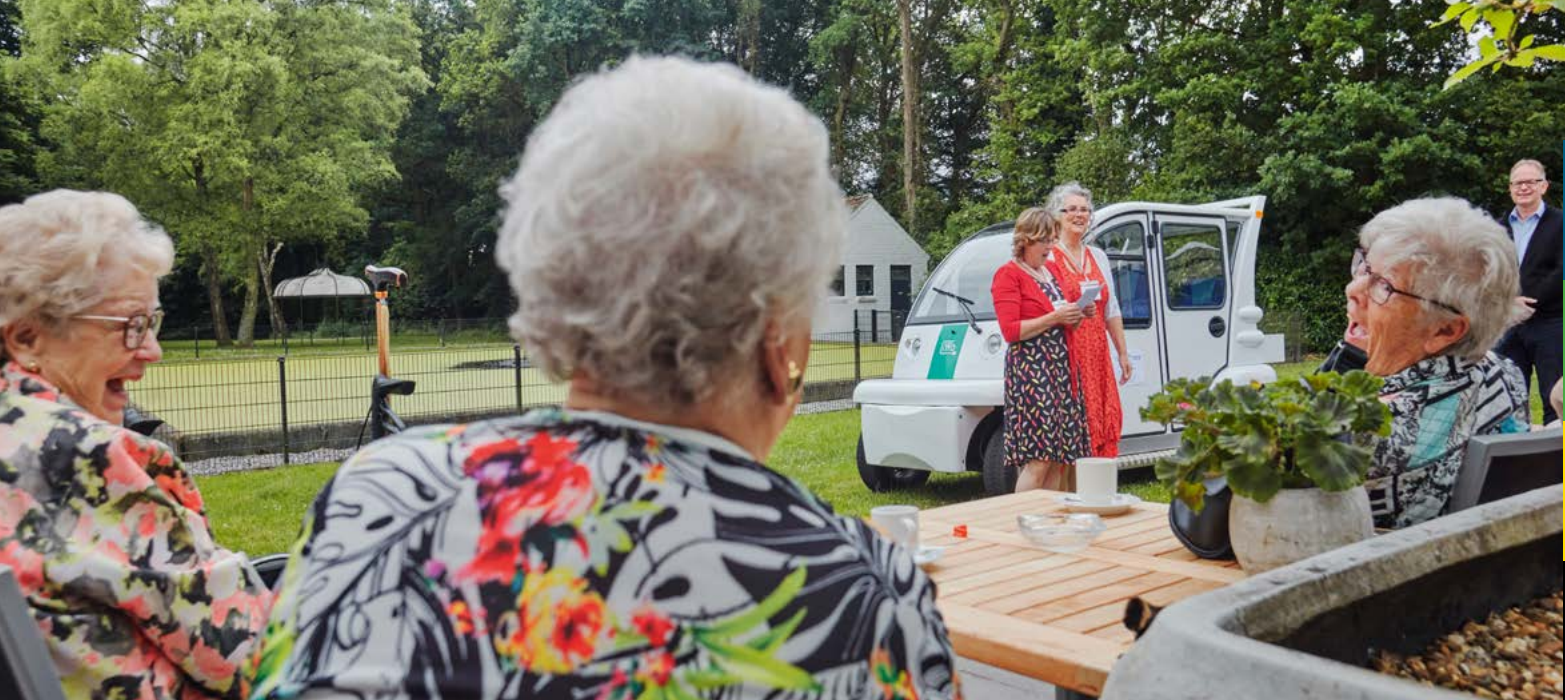
Berg en Dal: eerst konden ouderen die 'in het dal' wonen de activiteiten in het dorps huis 'op de berg' niet bereiken; nu worden ze met regelmaat door vrijwilligers in een elektrische Toek Toek gebracht en gehaald.